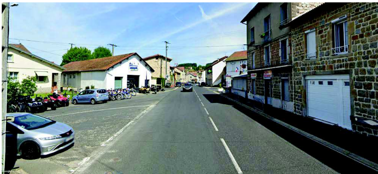
Vue actuelle de la Route de Lyon avec la devanture du magasin Dubost

Programme d'aménagement durable / Chabreloche / Oct. 2022