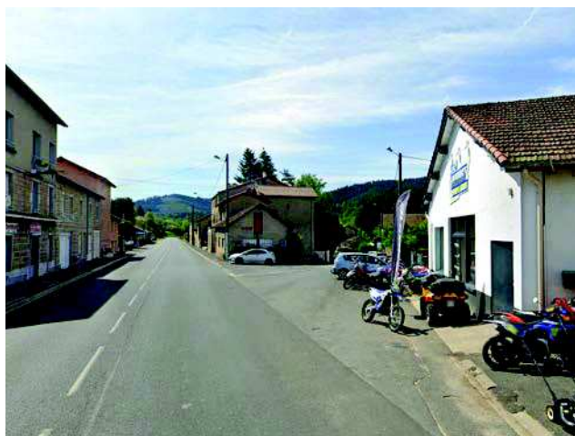
Vue actuelle de l'amorce de la Rue de la Gare