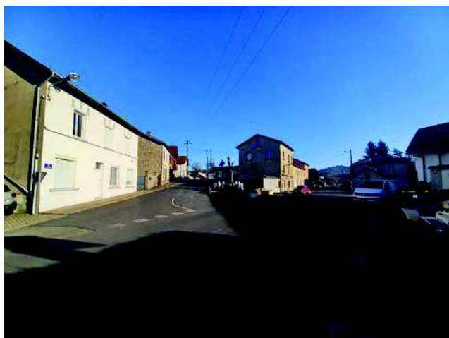
Vue actuelle du croisement entre la Route de Lyon et la Rue du Stade