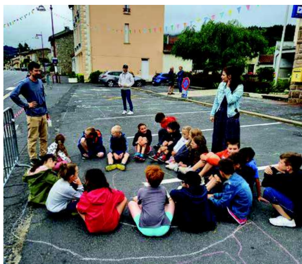
Des ateliers avec les scolaires ont permis de questionner les usages