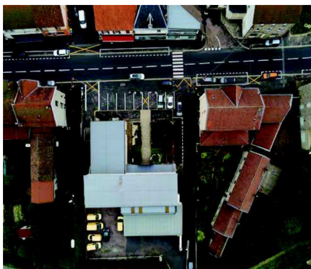
Vue actuelle de la place de la mairie