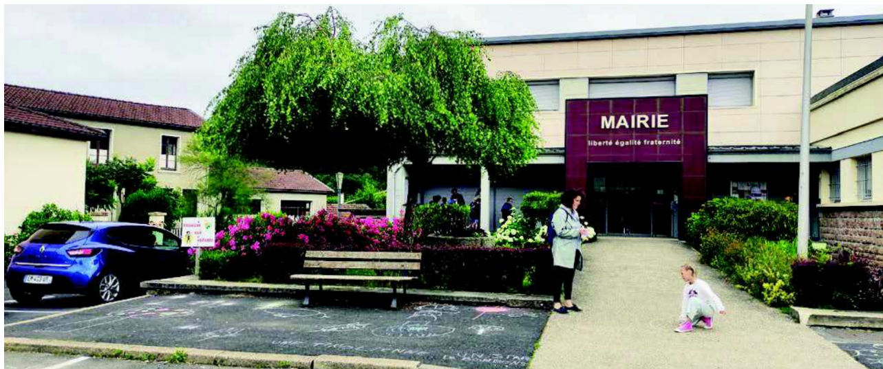
Le jardin ornamental est entretenu, mais il est généralement caché par les véhicules garés devant la mairie

Programme d'aménagement durable / Chabreloche / Oct. 2022