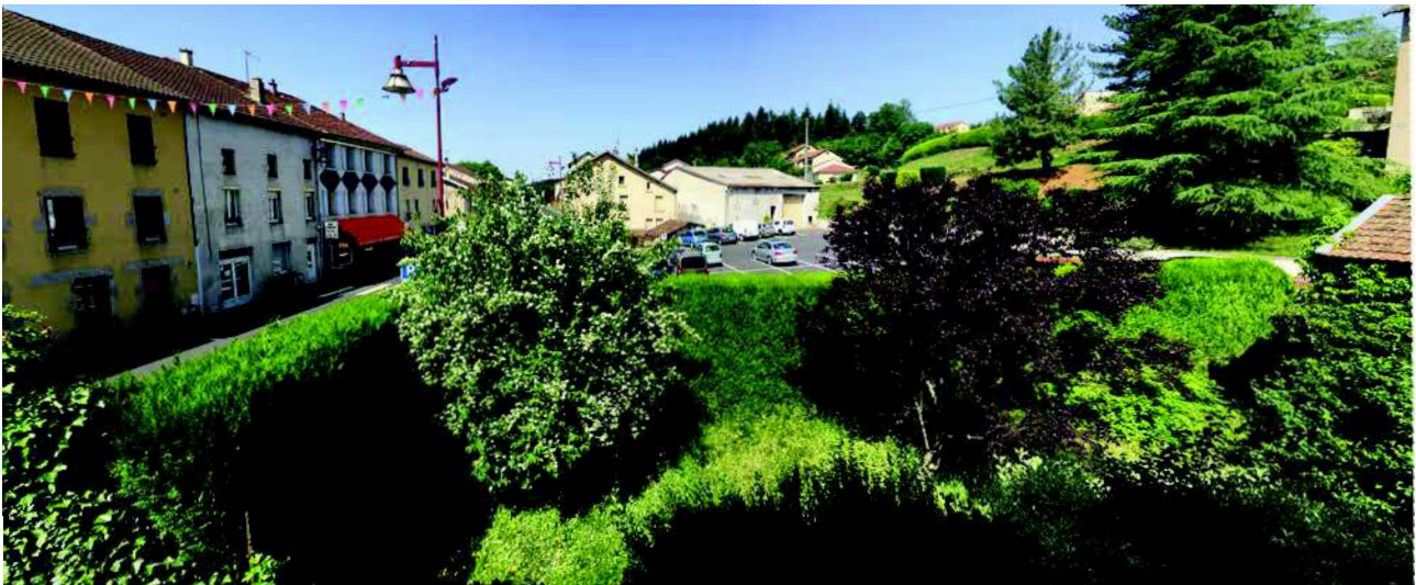
Vue depuis l'étage de l'ancienne boulangerie : une haie de tuyas coupe toute co-visibilité