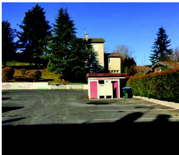
A part entre 12h et 14h, le parking est sous-fréquenté.