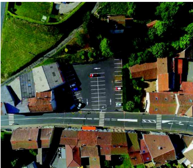
Vue actuelle de la place du Sabot (la rivière est canalisée dessous)