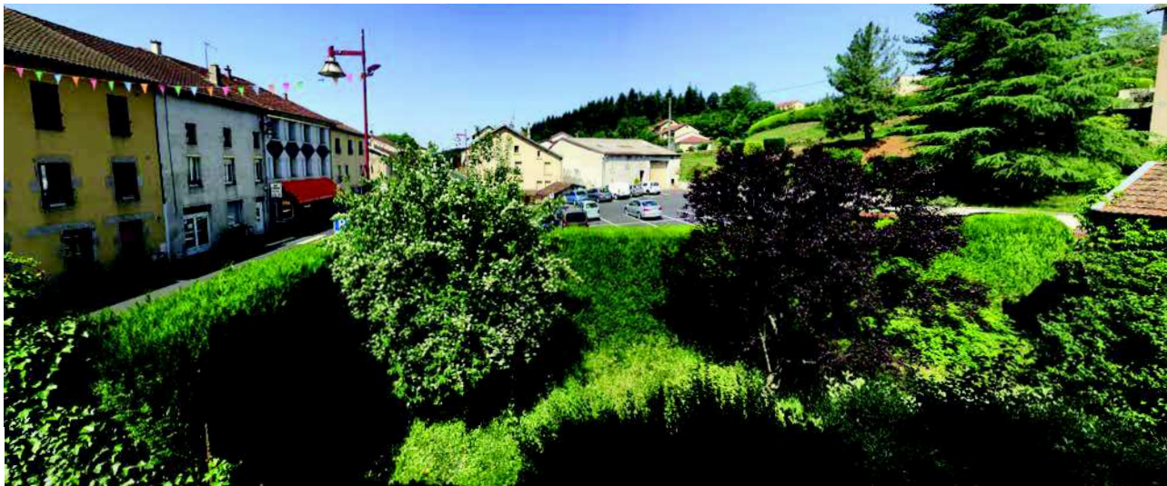
Vue depuis l'étage de l'ancienne boulangerie : une haie de tuyas coupe toute co-visibilité