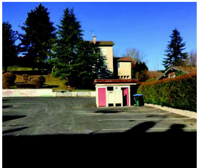
A part entre 12h et 14h, le parking est sous-fréquenté.