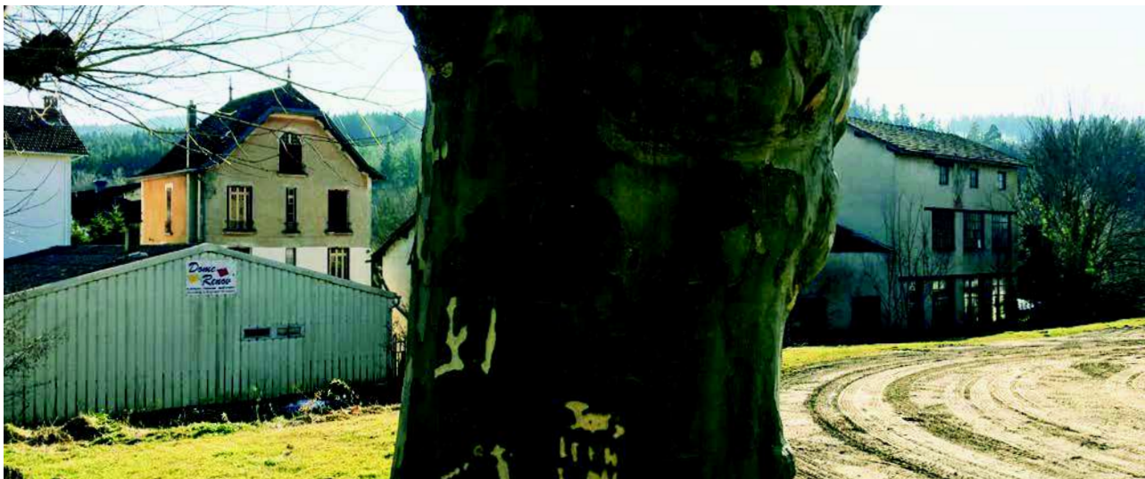
L'héritage industriel est peu réhabilité malgré des qualités certaines (larges ouvertures, lumière naturelle abondantes, rdc accessibles, ornements, etc)