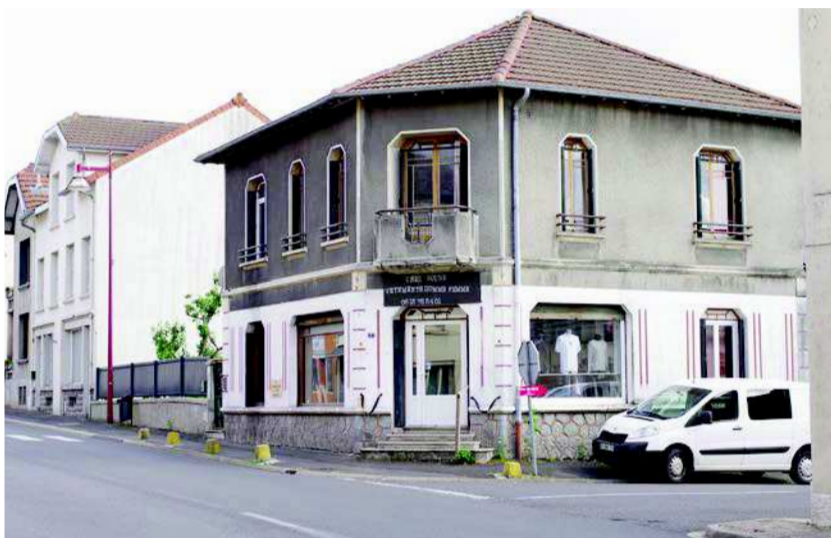
L'activité coutelière du début XXe s., à l'origine d'un patrimoine d'architecture domestique