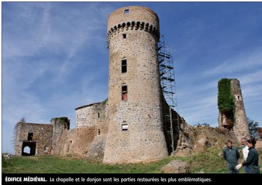
ÉDIFICE MÉDIÉVAL. La chapelle et le donjon sont les parties restaurées les plus emblématiques.

De la tête au pied, les propriétaires des lieux ne quittent pas leur tenue prête à supporter tous types de travaux, gants de chantier compris qu'ils gardent à portée de main. « Nous ne sommes pas très présentables.