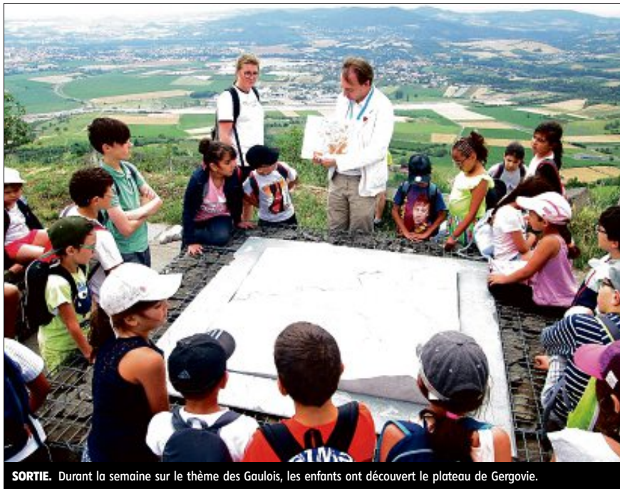
SORTIE. Durant la semaine sur le thème des Gaulois, les enfants ont découvert le plateau de Gergovie.