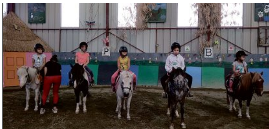
SÉJOUR. Attendu chaque année, le séjour équestre a encore affiché complet avec 20 enfants de 6 à 11 ans accueillis pendant cinq jours au centre de Mosnet, à Thiers.