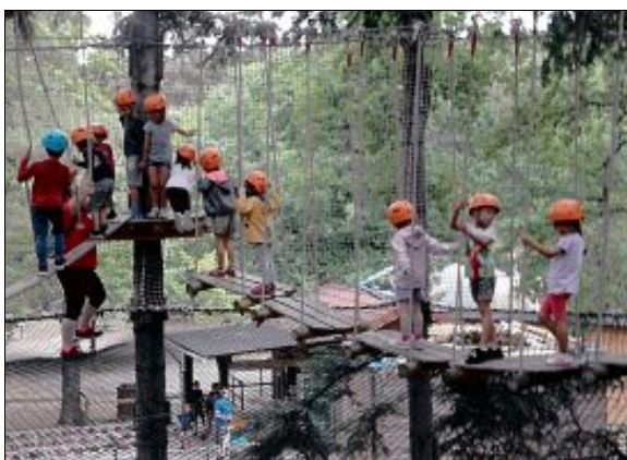
ACTIVITÉ. Parmi les nombreuses activités proposées cet été, les petits ont pu découvrir l'accrobranche à Châtel-Guyon.

Centre d'animation FAL 63, Accueil de Loisirs : rue Émile-Zola ; Tél. : 04.73.80.48.26 ; Mail : alsh.thiers@fal63.org