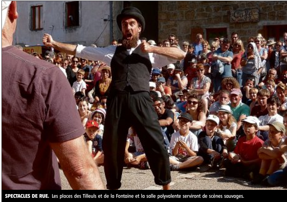
SPECTACLES DE RUE. Les places des Tilleuls et de la Fontaine et la salle polyvalente serviront de scènes sauvages.

Un festival qui est né d'un voyage avec les jeunes de l'association. « De-