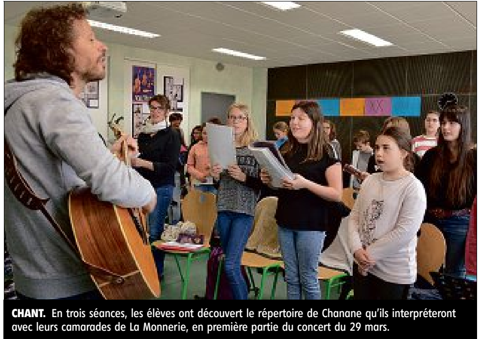
CHANT. En trois séances, les élèves ont découvert le répertoire de Chanane qu'ils interpréteront avec leurs camarades de La Monnerie, en première partie du concert du 29 mars.

À la guitare, l'artiste originaire de Clermont accompagne quelque 25 jeunes qui ont appris ses chansons. Ils travaillent la voix, le souffle, la posture. Tout doit être prêt pour le