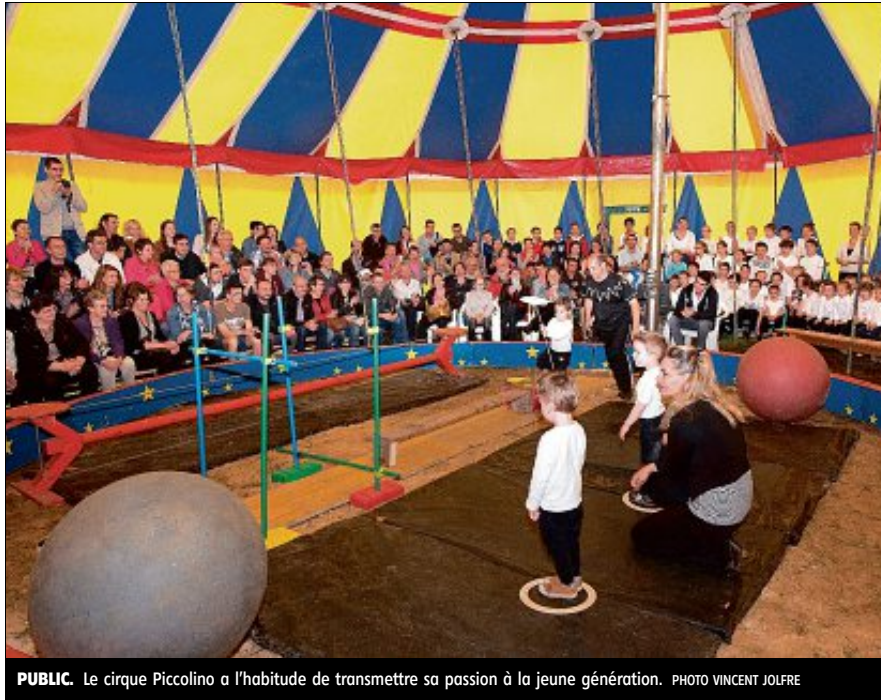
PUBLIC. Le cirque Piccolino a l'habitude de transmettre sa passion à la jeune génération.

Ainsi, fort d'une expertise de 25 ans, Piccolino va proposer durant trois après-midi, de 14 heures à 16 heures, des ateliers d'initiation aux arts du cir-