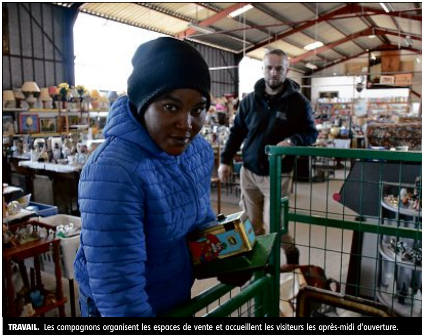
TRAVAIL. Les compagnons organisent les espaces de vente et accueillent les visiteurs les après-midi d'ouverture.

Si l'association indépendante accueillait une dizaine de personnes à Puy-Guillaume,