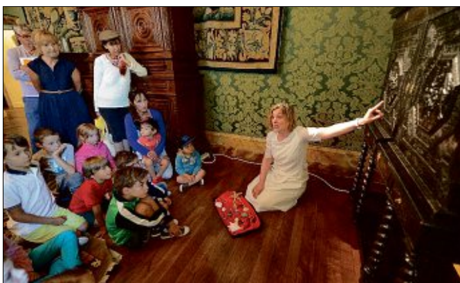
Une visite commentée sera réservée aux familles, et plus spécialement aux enfants, samedi 6 avril, à 15 heures.

Pourquoi les meubles ? Car l'année 2019 revêt un caractère un peu particulier pour le Château. Il y a 20 ans, une formation ébénisterie restauration voyait le jour dans ses murs. Depuis, chaque année, des élèves de l'Institut professionnel de Bains apprennent l'art de restaurer des meubles anciens au Château. « C'est très intéressant pour nous que nos meubles (ainsi que ceux du Domaine