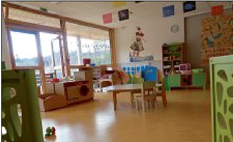
MULTI-ACCUEIL. À Celles-sur-Durolle.

En matière de garde petite enfance pour des enfants de 3 mois à 3 ans, le territoire dispose de deux équipements communautaires : le multi-accueil de Celles-sur-