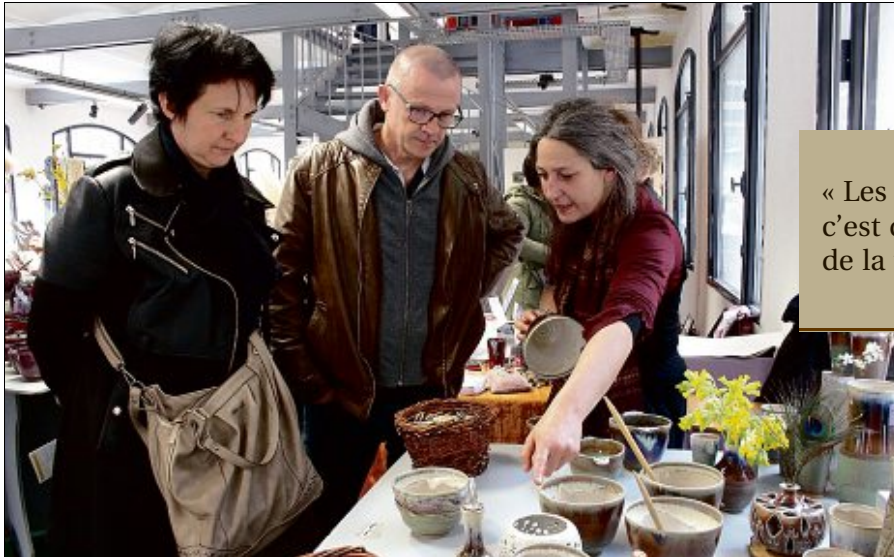
Lors de l'édition précédente, 1.500 visiteurs sont venus à la rencontre des artisans de l'Usine du May.

Si la manifestation, à l'échelle européenne, est organisée pour la 13 e année consécutive, pour Thiers, ce sera la 4 e édition. Et si la recette est la même, les organisateurs sont parvenus, encore une fois cette année, à varier les ingrédients. « Sur les 22 artisans (dont 8 d'entre eux à découvrir ci-contre) qui seront présents à l'Usine du May, notre objectif est de proposer des nouveautés, et de diversifier les métiers. Nous sommes donc assez contents de faire des nouvelles pro-