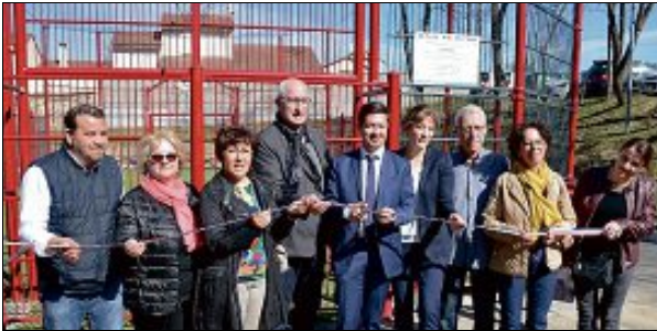
RUBAN. Les nombreux partenaires du projet réunis pour l'inauguration.

Cet équipement de proximité, ouvert depuis le début de l'année, permet de pratiquer le football, le basket ou le handball. De quoi répondre à un besoin fort identifié sur le quartier. « Quand je suis devenue présidente du Conseil citoyen, je suis allée voir les jeunes et je leur ai demandé ce qu'ils voulaient »,