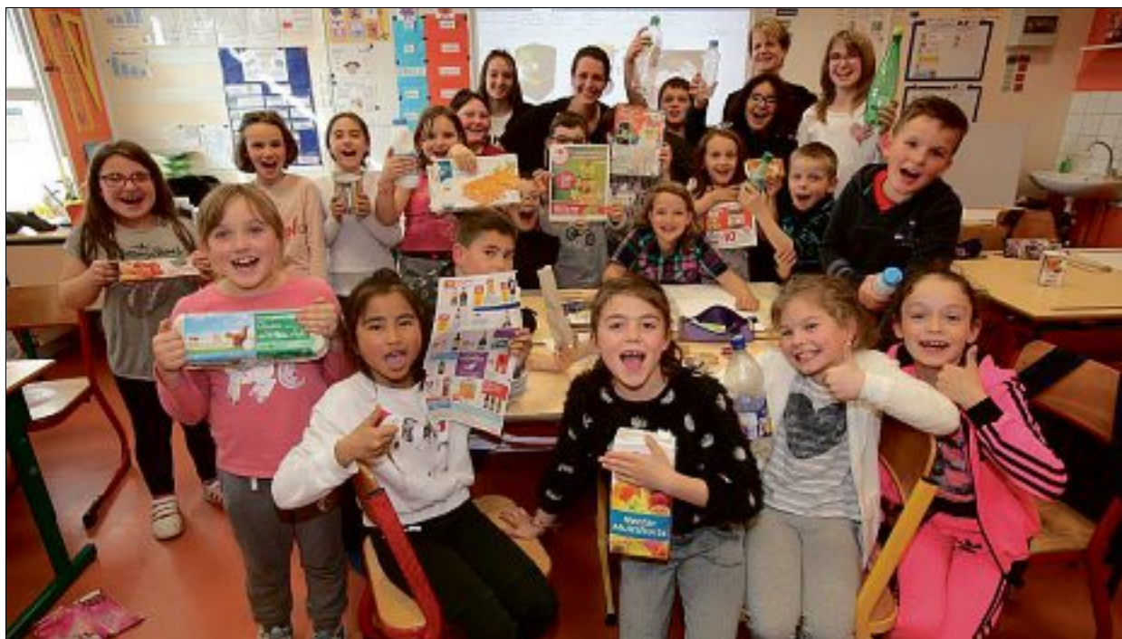
AVEC LA CATICHE. Les 22 élèves de CE2-CM1 ont découvert l'intérêt de trier les déchets et devront l'expliquer à leurs camarades.

Une classe de l'école François-Mitterrand de Puy-Guillaume a terminé, vendredi, un cycle de trois animations dispensées par la Catiche, service Education à l'Environnement de Thiers Dore et Montagne, sur le thème des déchets.