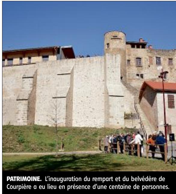
PATRIMOINE. L'inauguration du rempart et du belvédère de Courpière a eu lieu en présence d'une centaine de personnes.

« Démolir les deux bâtiments vétustes situés sur les parcelles en surplomb du rempart restauré et dégager l'espace anciennement privatif pour y aménager un espace public, c'était transformer la ca-