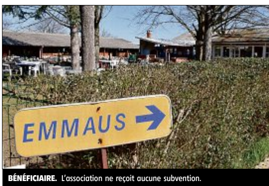
BÉNÉFICIAIRE. L'association ne reçoit aucune subvention.

Depuis quelques années, l'association est bénéficiaire mais nous avons toujours besoin d'argent pour financer des projets et accueillir toujours plus