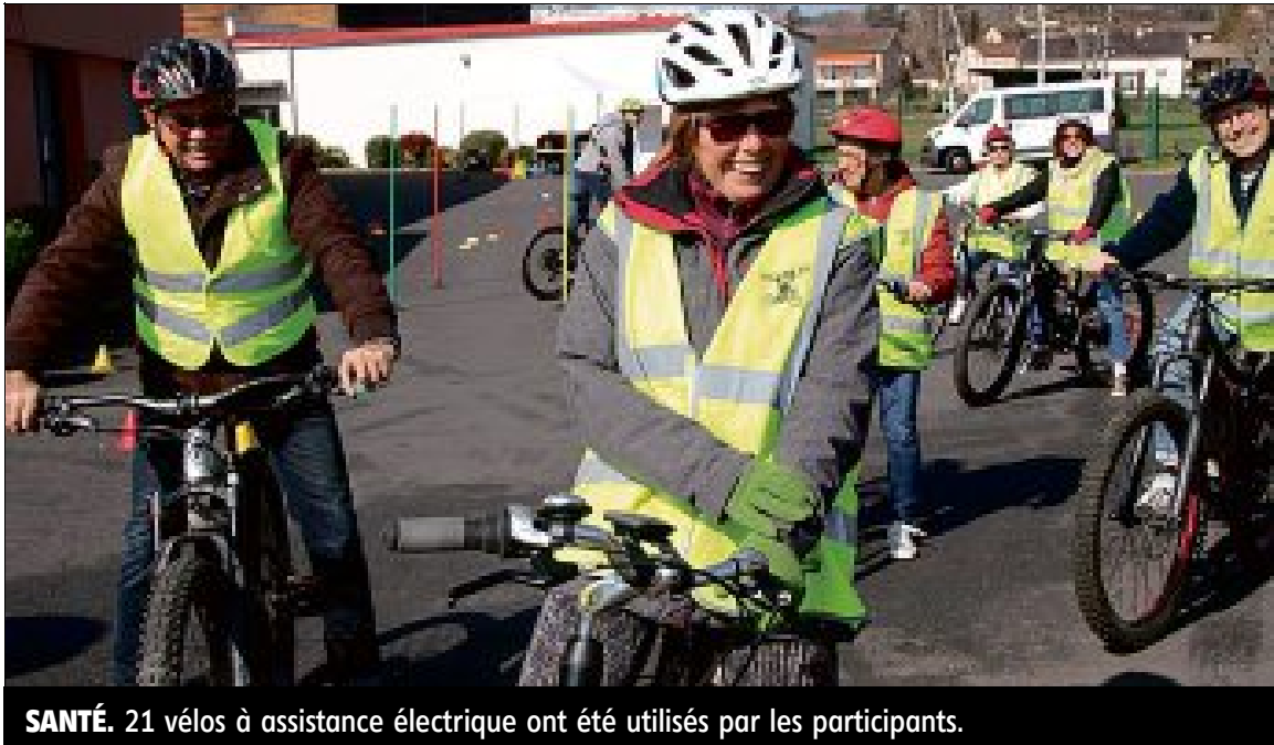
SANTÉ. 21 vélos à assistance électrique ont été utilisés par les participants.

L'opération « Roulez seniors » a connu un beau succès. Quatre groupes à vélo à assistance électrique ont emprunté chemins et circuit balisé.