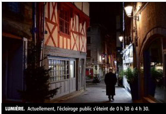
LUMIÈRE. Actuellement, l'éclairage public s'éteint de 0 h 30 à 4 h 30.

Lancée le 20 juillet 2017, l'expérimentation a été concluante selon le comité de suivi regroupant des représentants de la mairie, la sous-préfecture, la gendarmerie, les sapeurs-pompiers et la population. L'économie sur la facture d'électricité se monte à 80.000 €, auxquels il faut ajouter 35.000 € économisés grâce au passage en LED de