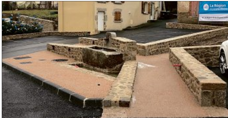
Les murets du centre-bourg ont été entièrement faits à partir de vieilles pierres issues de la démolition de quatre grandes maisons de la commune.

Au niveau du centre-bourg, la municipalité a profité de la démolition de quatre grandes maisons, acquises au préalable. « Ces maisons étaient faites de vieilles pierres. Nous les avons récupérées et stockées, assure le premier magistrat. Dans un second temps, l'intégralité