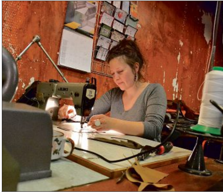
Les métiers d'art représentent un véritable atout pour le développement du bassin thiernois. (PHOTO D'ILLUSTRATION)

Et parmi ces entreprises labellisées, de nombreuses sont dans le secteur des métiers d'art. « Il existe en France plus de 200 métiers répertoriés comme mé-