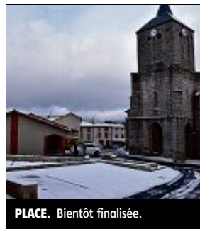
PLACE. Bientôt finalisée.

Un autre chantier de restructuration de centre-bourg est en cours à Celles-sur-Durolle. Plus avancé qu'à La Monnerie, il doit se terminer en ce début 2019.