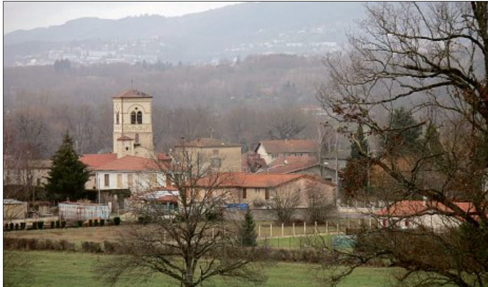
Coupé en deux, le bourg de Néronde-sur-Dore peine à trouver une véritable identité.

« C'est un vrai problème sur la commune. Les gens ne se connaissent pas, la jeunesse du territoire on ne la connaît pas, les nouveaux ne viennent pas se