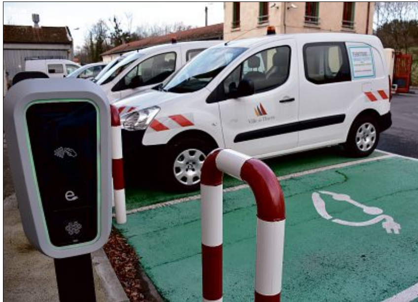
SERVICES TECHNIQUES. Sur 215.000 € d'investissement pour l'achat de sept véhicules électriques et l'installation de bornes de recharge, la Ville de Thiers a touché 100.000 € dans le cadre du dispositif TEPCV.

permis d'accélérer des investissements que la collectivité avait prévus. Malheureusement, ce dispositif a disparu... Il faudra rester attentif aux nouvelles