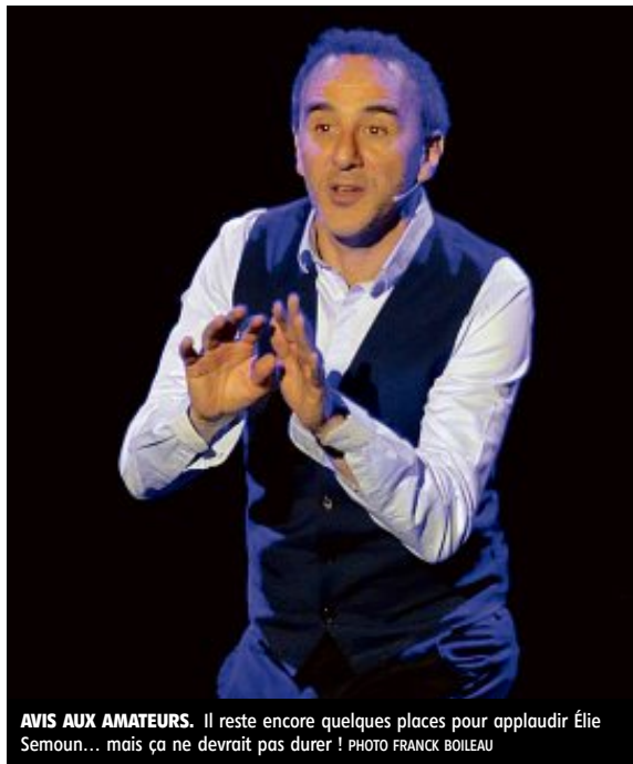
AVIS AUX AMATEURS. Il reste encore quelques places pour applaudir Élie Semoun... mais ça ne devrait pas durer !

Pour les amateurs, il reste encore quelques places pour applaudir Élie Semoun, le 18 mai (tarifs : 24 € et 20 €). Comme pour D'Jal, il s'agit d'une nouvelle création. Après une tournée de plus de 200 dates pour son dernier spectacle, Élie Semoun revient sur scène avec une nouvelle galerie de portraits plus originaux, plus profonds,