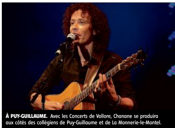
À PUY-GUILLAUME. Avec les Concerts de Vologne, Chanane se produira aux côtés des collégiens de Puy-Guillaume et de La Monnerie-le-Montel.

Nuits classiques de Thiers organisées par les Rencontres Arioso débiteront par un stage de