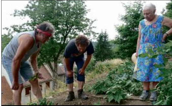
PREMIÈRE. La mairie va louer des terrains à des privés qui souhaitent les cultiver. PHOTO D'ILLUSTRATION

Église. La troisième et dernière tranche de la restauration extérieure de l'église Saint-Martin