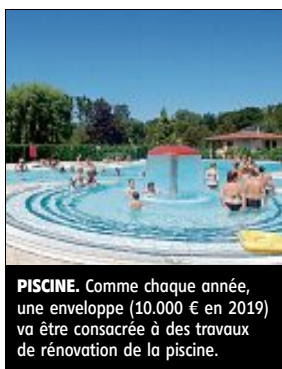
PISCINE. Comme chaque année, une enveloppe (10.000 € en 2019) va être consacrée à des travaux de rénovation de la piscine.

Foyer logement. Autre grand chantier, la rénovation du foyer