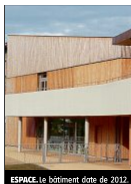
ESPACE. Le bâtiment date de 2012.