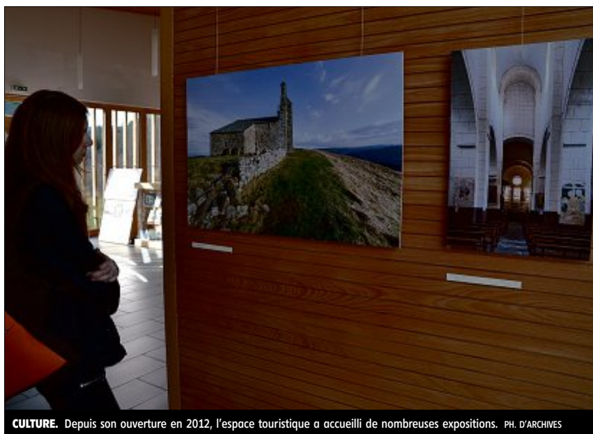
CULTURE. Depuis son ouverture en 2012, l'espace touristique a accueilli de nombreuses expositions.