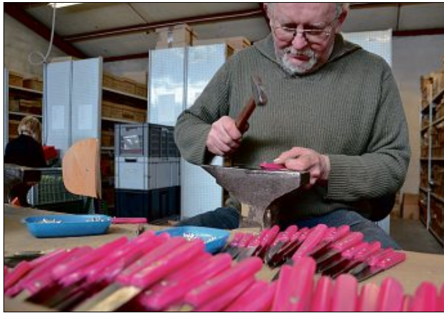
Une visite de l'entreprise Jean Dubost, à Viscomtat, est organisée jeudi 21 mars, pour les demandeurs d'emploi.

Cette semaine permet, d'une manière ludique, de dénoncer les clichés que