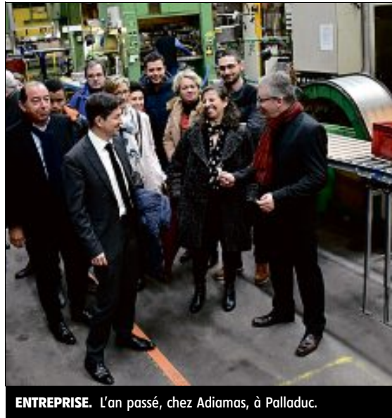
ENTREPRISE. L'an passé, chez Adiamas, à Palladuc.