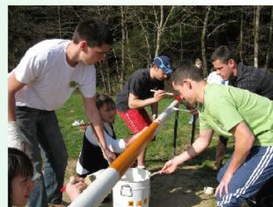
Une leçon de civisme !

ATTENTION : baignade non surveillée, soyez prudents, surveillez les enfants.